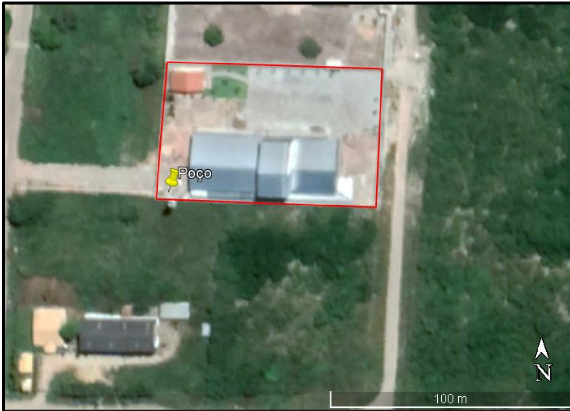
Figura 2. Ponto do poço profundo

O poço está posicionado com as seguintes coordenadas UTM: 9544502 N/ 0557761 E UTM SIRGAS 2000.