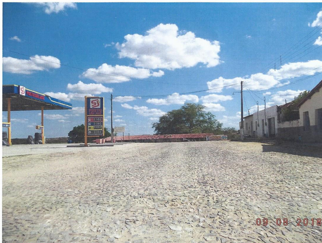
Fotografia 2 – trecho do acesso rodoviário ao Posto São José, na CE-166, próximo ao km 84,78, no distrito de Encantado, município de Quixeramobim/Ce. Sentido Encantado – Senador Pompeu.