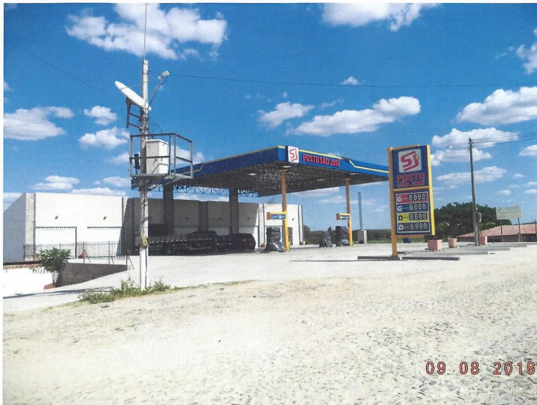
Fotografia 3 – trecho do acesso rodoviário ao Posto São José, na CE-166, próximo ao km 84,78, no distrito de Encantado, município de Quixeramobim/Ce. Sentido Encantado – Senador Pompeu.