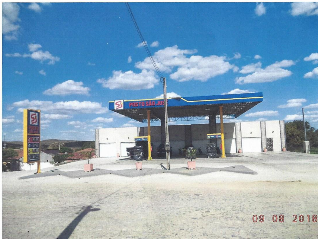
Fotografia 4 – local do acesso rodoviário ao Posto São José, na CE-166, próximo ao km 84,78, no distrito de Encantado, município de Quixeramobim/Ce. Visto do lado direito para o esquerdo.