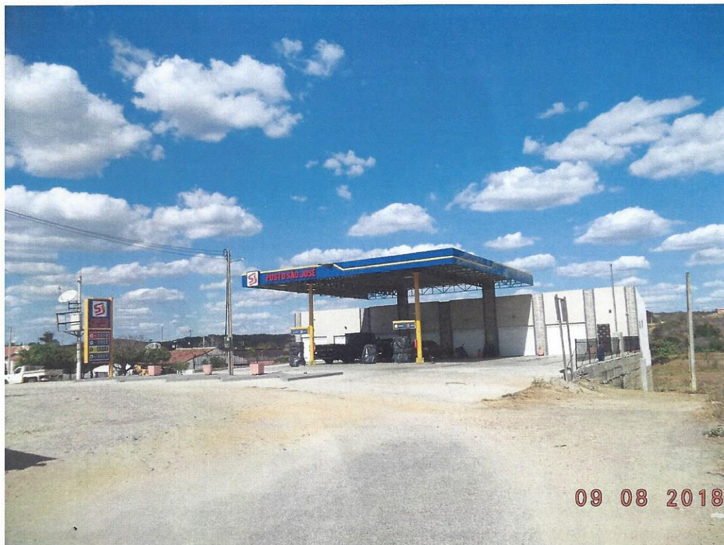
Fotografia 6 – trecho do acesso rodoviário ao Posto São José, na CE-166, próximo ao km 84,78, no distrito de Encantado, município de Quixeramobim/Ce. Sentido Senador Pompeu – Encantado.