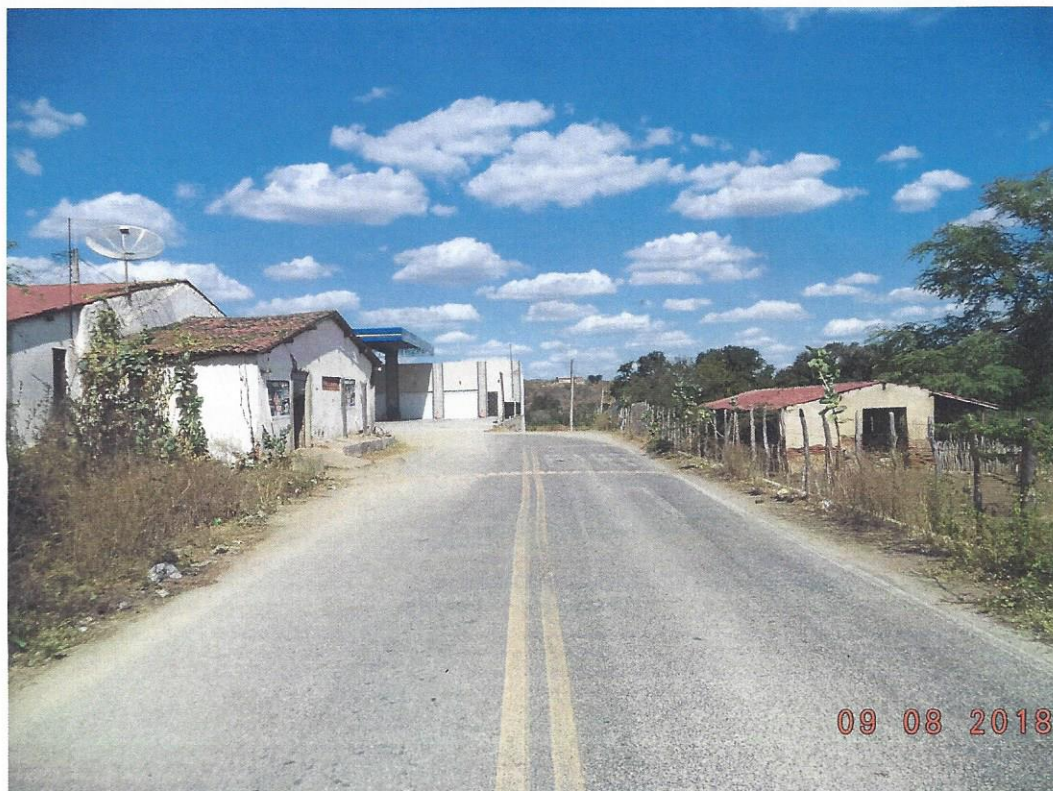
Fotografia 5 – trecho do acesso rodoviário ao Posto São José, na CE-166, próximo ao km 84,78, no distrito de Encantado, município de Quixeramobim/Ce. Sentido Senador Pompeu – Encantado.