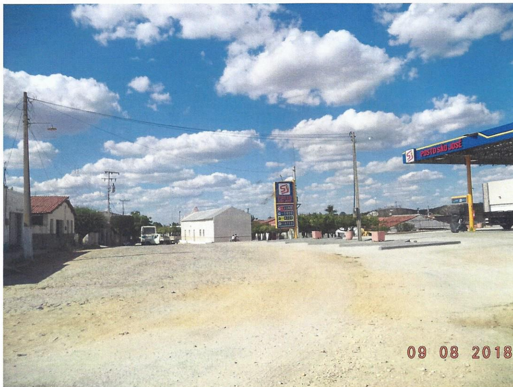
Fotografia 7 – trecho do acesso rodoviário ao Posto São José, na CE-166, próximo ao km 84,78, no distrito de Encantado, município de Quixeramobim/Ce. Sentido Senador Pompeu – Encantado.