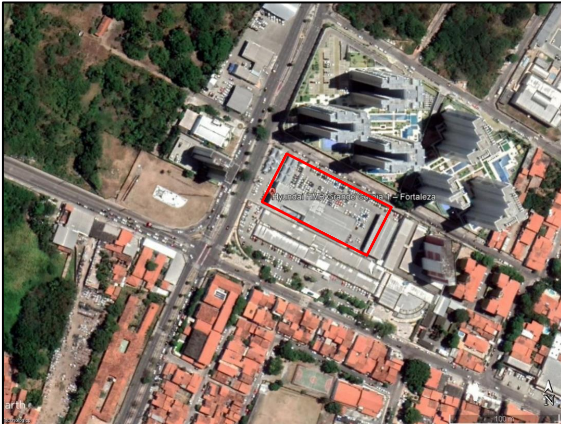
Figura 1. Localização Concessionária Grande Coreia.