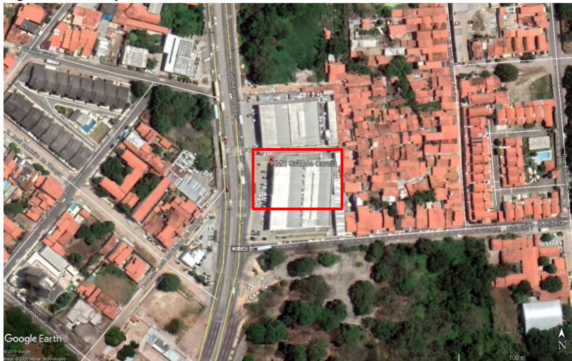
Figura 1. Localização Concessionária Grande Coreia.