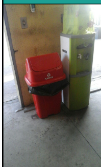
Foto dos recipientes de acondicionamento dos resíduos devidamente identificados