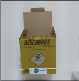
Foto dos recipientes de acondicionamento dos resíduos devidamente identificados

O PGRSS apresentado é referente ao manejo dos resíduos gerados pelo estabelecimento CLINICA PEDIÁTRICA ALBERTO LIMA S/S LTDA. Os resíduos dos Grupos A e E (Infectantes e Perfuro cortantes): são provenientes do atendimento médico prestado nas consultas e ambulatório. Os resíduos serão coletados pela empresa BRASLIMP serão destinados ao Centro de Tratamento de Resíduos Perigosos - CTRP. Os resíduos do Grupo D (Não recicláveis), tais como: varrição, papéis sanitários e embalagens não recicláveis, serão destinados ao aterro sanitário através do serviço de coleta pública. Tendo em vista que o estabelecimento está em fase de adequação para renovação do PGRSS, os quantitativos apresentados, trata-se de uma estimativa de geração. O estabelecimento se responsabiliza por ofertar e capacitação ou treinamento periodicamente para os funcionários envolvidos no manejo dos resíduos. O cumprimento e a operacionalização do PGRSS fica sob a responsabilidade do estabelecimento gerador do resíduo. Durante a vigência do plano (03 anos), o estabelecimento poderá solicitar ao elaborador as atualizações do manejo do resíduo. O PGRSS deverá ser mantido sempre atualizado, impresso e disponível à fiscalização.