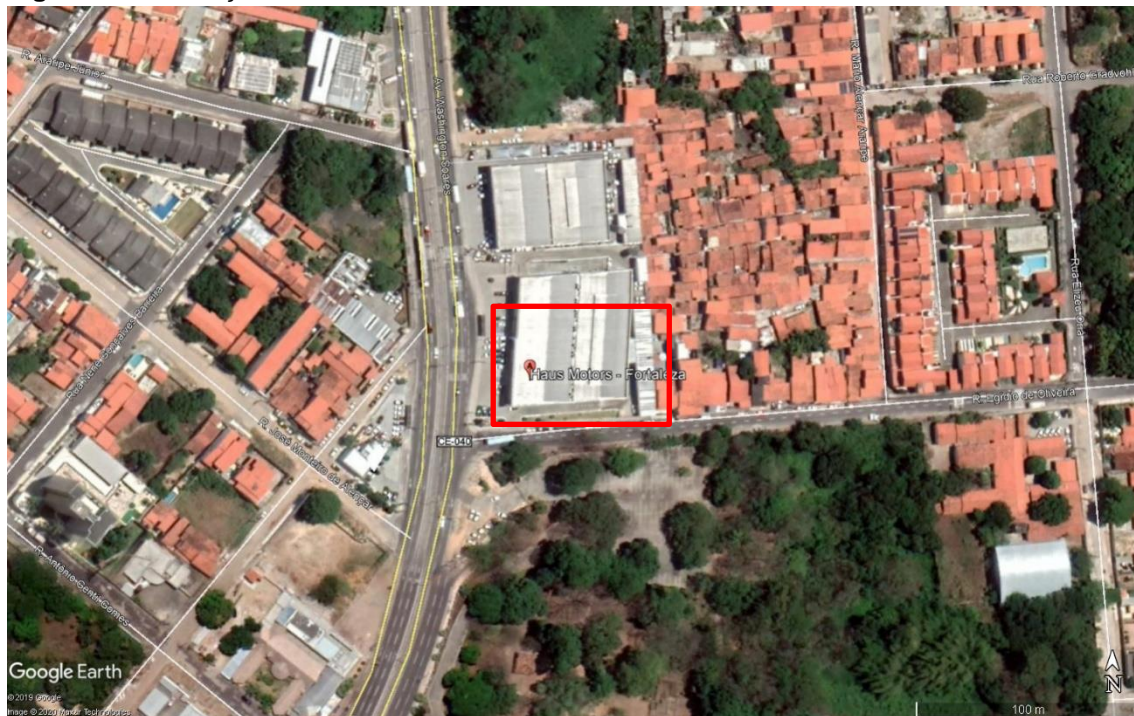
Figura 1. Localização Concessionária HAUS.