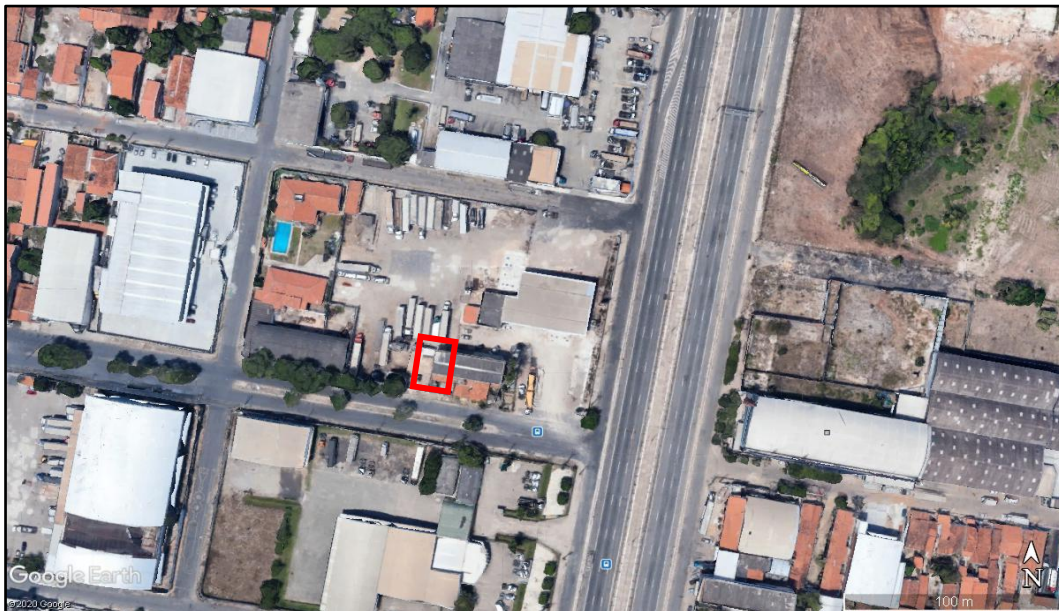
Figura 1: Planta de situação