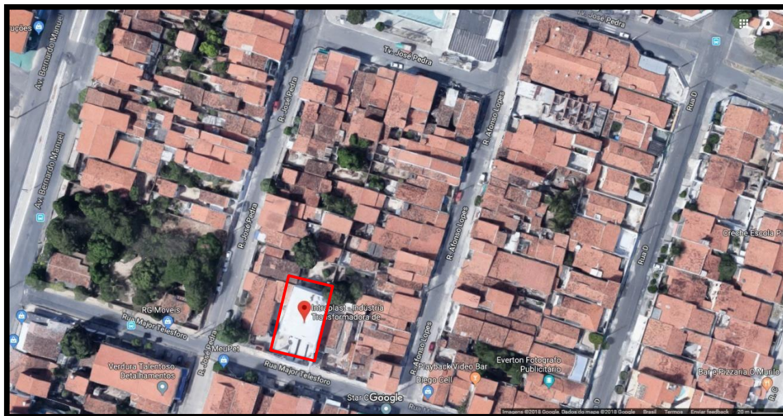
Figura 1: Planta de situação