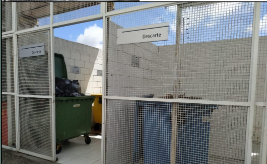
JUSTIFICATIVAS FOTOS ABRIGOS