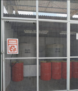
Fotos do abrigo externo dos resíduos