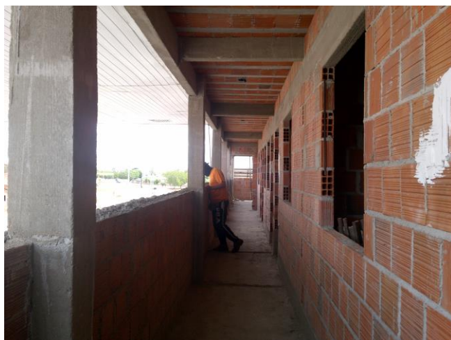
Foto 03: Imagens do interior da obra da pousada, a qual já encontra-se em estágio avançado.