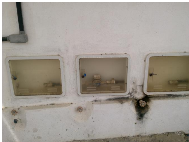
Foto 05: Relógios hidrômetros da CAGECE.