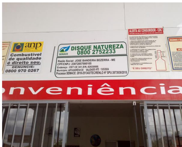
Foto 04: Placa da licença de operação do Posto JB, vigente.