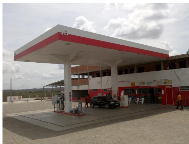
Foto 02: Outro ângulo do Posto JB, com obras da pousada no pavimento superior.