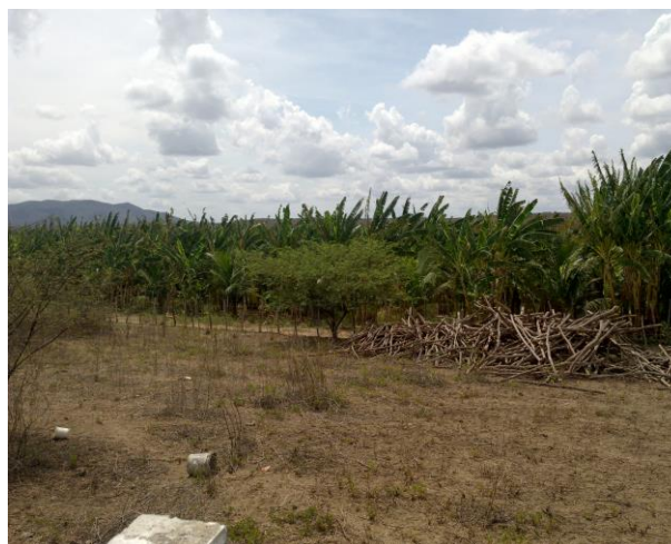
Foto 06: Imagem ao fundo do terreno, no sentido do Rio Curú.