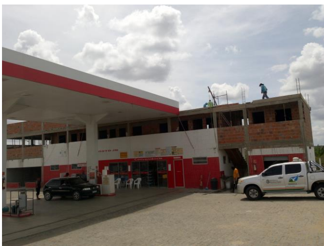
Foto 01: Posto JB, com obras da pousada no pavimento superior.