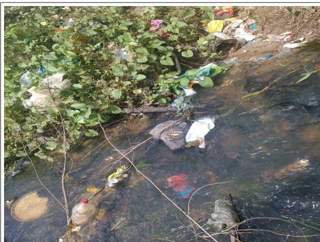
Foto 03- Trecho Final do Canal a ser construído, com muito lixo.