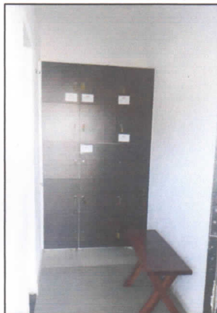
ARMARIOS DOS COLABORADORES