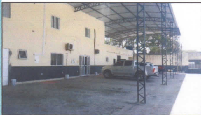
LOCAL DA GUARDA DOS VEÍCULOS