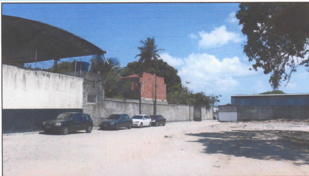
VISÃO DO LADO DE FORA DO EMPREENDIMENTO