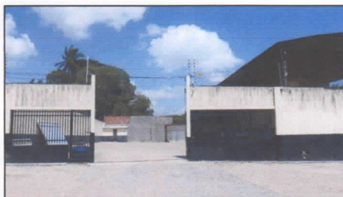
VISÃO FRONTAL DA ENTRADA DO